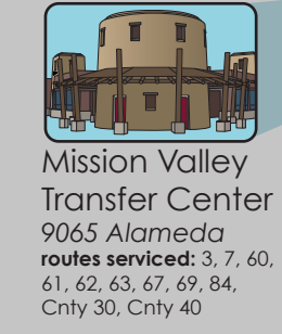
Mission Valley Transfer Center 9065 Alameda routes serviced: 3, 7, 60, 61, 62, 63, 67, 69, 84, Cnty 30, Cnty 40

Transfer policy • Política para transbordar Transfers must be requested upon boarding the bus. Pases de transbordos deben completarse al abordar el autobús. Transfer fees apply to each and every transfer needed to get to your destination. La tarifa de los pases de transbordos se aplica cada una de las veces que transborde hasta llegar a su destino. The transfer is good on date issued for a one time use within a 2-hour limit. El pase de transbordos es válido únicamente en el día expedido y por un tiempo límite de 2 horas. All transfers must be given to the driver upon use. Todos los pases de transbordos deberán entregarse al chofer del autobús. The transfer is valid only at designated transfer points. Pases de transbordos son válidos únicamente en los puntos designados como de transbordo. The transfer is not valid on the issuing route or any returning route. Pases de transbordos NO son válidos en la misma ruta o en rutas de regreso.